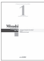
Miyoshi ピアノ・メソード 第1巻

〒151-0053 東京都渋谷区代々木1-36-4 Miyoshi Net事務局 (カワイ出版内) Tel.03-3374-7595 Fax.03-3320-8477 http://editionkawai.jp/miyoshi/