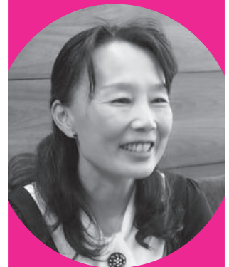
作曲家・ピアニスト 安倍美穂氏 (あべ みほ)