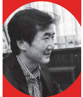
作曲家 千原英喜氏 (ちはらひでき)

◎プロフィール◎ 東京藝術大学音楽学部作曲科卒業。東京藝術大学大学院修士課程修了。 東京藝術大学資料館(現・大学美術館)作品買上。 日本音楽コンクール、イタリアトリエステ市賞、ドレスタン・ウエーバー作曲賞、グイード・ダレッツオ・コンコロソなどに入賞。 “音楽は時空を超えて”を題し、西洋音楽と日本の伝統文化やアートなどとの出会いの中から新たな創作の源泉を得つつ、グローバル時代であればこそ日本人としてのアイデンティティーあるものを、との念いを込めて作曲活動をおこなっている。