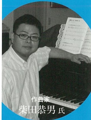
作曲家 柴田恭男氏