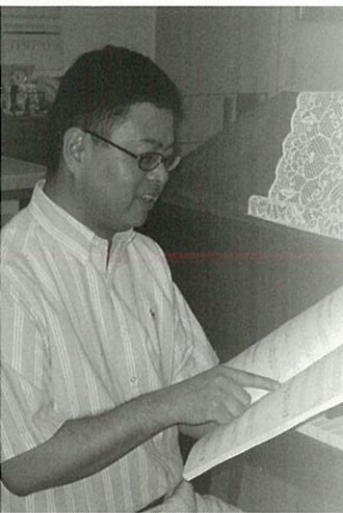
6月中旬 岐阜の自宅にて

(株)河合楽器製作所・出版部 〒151-0053 東京都渋谷区代々木1-36-4 Tel.03-3374-7595 / Fax.03-3320-8477 / http://www.kawai.co.jp/