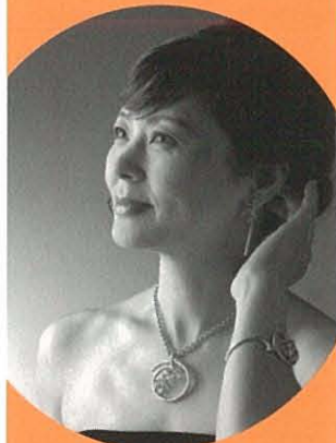
上原由記音氏 ピアニスト