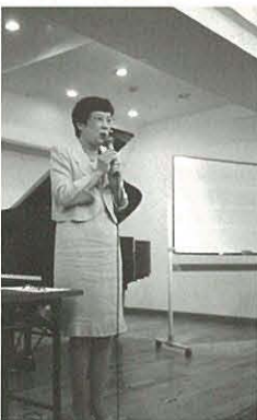
いつも人気の指導法講座

作曲家の意図を理解し、時代を超えて作曲家のメッセージを共有することは、自分の世界が広がることになりま。それは日常的な体験以外のものも広いもの、