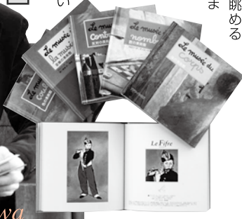
『美術館シリーズ(全9冊)』