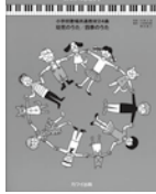
「弾き歌いピアノテキスト」